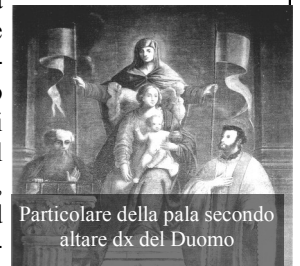
Particolare della pala secondo altare dx del Duomo

Anna e Gioacchino sono i genitori della Vergine Maria. Gioacchino è un pastore e abita a Gerusalemme, anziano sacerdote è sposato con Anna. I due non avevano figli ed erano una coppia avanti con gli anni. Un giorno mentre Gioacchino è al lavoro nei campi, gli appare un angelo, per annunciarli la nascita di un figlio ed anche Anna ha la stessa visione. Chiamano la loro bambina Maria, che vuol dire